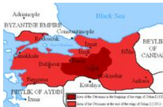
عثمانی در دوره اورخان