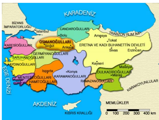
بیگ نشین های آناتولی هم دوره عثمان