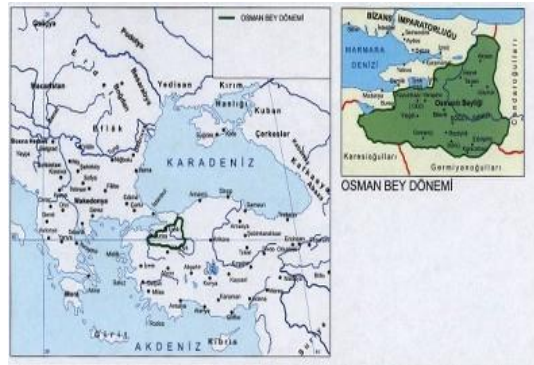
عثمانی در روزگار عثمان بیگ