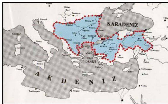
عثمانی در عصر بایزید اول