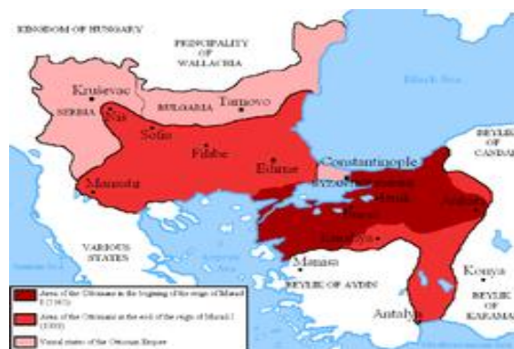
عثمانی در عهد مراد اول