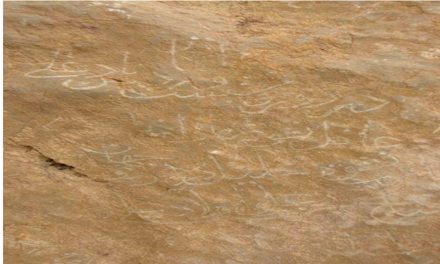
تصویر شماره یک: سنگ‌نوشته مربوط به شاه خلیل‌الله اول در انجدان

جانشین امام خلیل‌الله اول نیز نام صوفیانه نورالدهر (شاه نورالدین) علی داشت. این امام را که سی‌وهشتمین امام در سلسله امامان محسوب می‌شود، می‌توان با نورالدهر (بن) خلیل‌الله که در رجب ۱۰۸۲ ق در گذشته، یکی دانست. ۱ خلیل‌الله اول و نورالدهر، در انجدان دفن شده‌اند. ۲