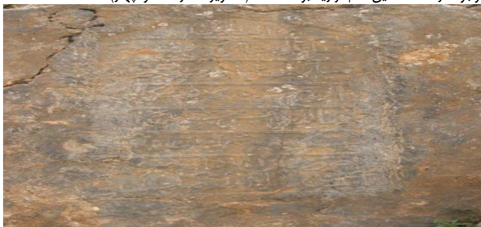
تصویر شماره سه: کتیبه ایجاد چشمه توسط نورالدهر در قتلو «بانی و ساعی چشمه مبارک‌آباد... این بنده درگاه نورالدهر الحسینی...»

پیرامون آن تلاش نمودند و این امر را با ایجاد و توسعه برخی آرامگاه‌ها، مساجد، قلعه‌ها، چشمه‌ها و... اجرایی کردند. در برخی از سنگ‌نوشته‌ها و کتیبه‌های دره چکاب و قتلو، در پیرامون انجدان، از فعالیت امامان فرقه نزاری برای ایجاد چشمه‌ها و درختکاری صحبت به میان آمده است. مشخصاً نورالدهر، فرزند خلیل‌الله انجدانی و سی‌وهشتمین امام نزاری انجدان، بر اساس دو کتیبه موجود در جهت ایجاد چشمه‌های چکاب و مبارک‌آباد که امروزه به قتلو نامبردار شده، کوشیده است. درختکاری دره چکاب نیز بر اساس سنگ‌نوشته موجود، از اقدامات این امام نزاریه بوده است. ۱ (تصاویر شماره سه و چهار)